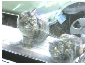
(↑左がホッペ、右がミミ)