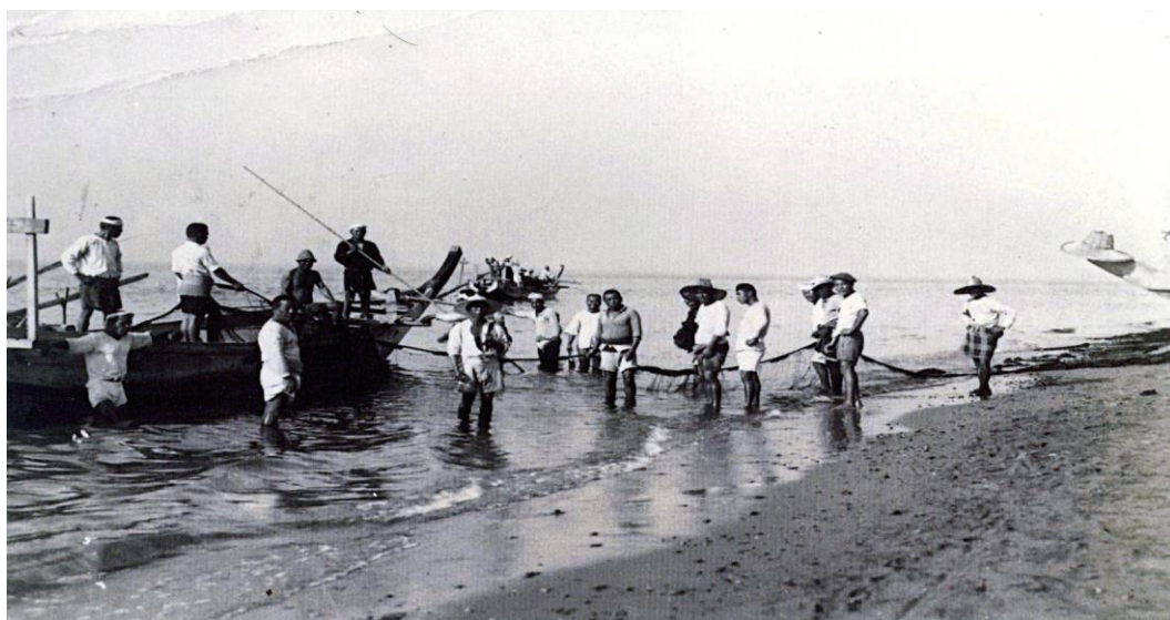
(泉大津市教育委員会生涯学習課に資料提供して頂き掲載しています。)